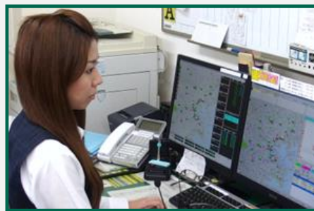
配車センターの無線配車の様子

当日の配車はオペレータがGPSで一番近い車を探し無線で配車しますが、一部のお得意先では翌日の予約があり、電話やEメールで手配していたため、時間が掛かり、オペレータに負荷が掛かっていました。